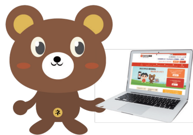
ねんきんクマ 「ねんきんネット」マスコット